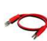
香蕉頭轉鱷魚夾 連接線 (選配)